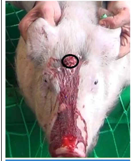
Größeres Ferkel 26 kg Lebendgewicht