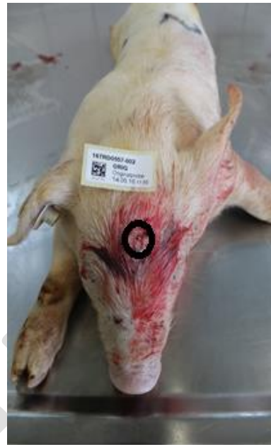
Saugferkel 5 kg Lebendgewicht