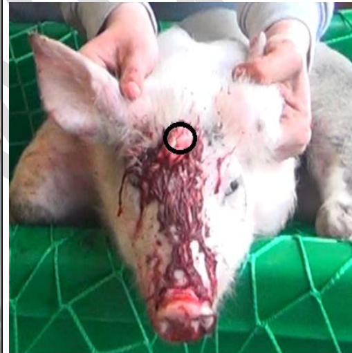
Größeres Ferkel 13 kg Lebendgewicht